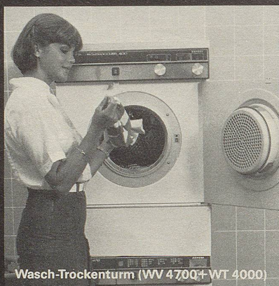
Wasch-Trockenturm (WV 4700+ WT 4000)