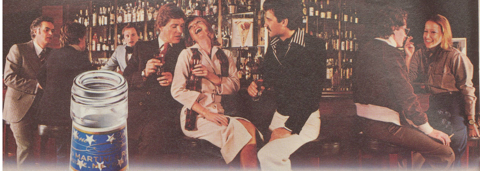
... auch in der Traveller's Bar im Hotel Zürich.