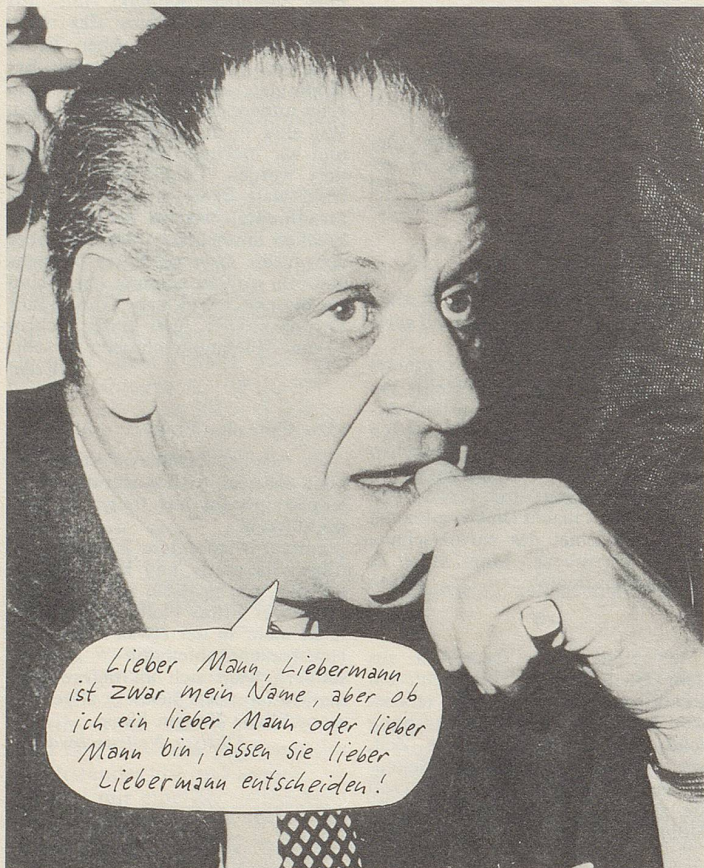
Opernhaus-Intendant Rolf Liebermann

Lieber Mann, Liebermann ist zwar mein Name, aber ob ich ein lieber Mann oder lieber Mann bin, lassen Sie lieber Liebermann entscheiden!