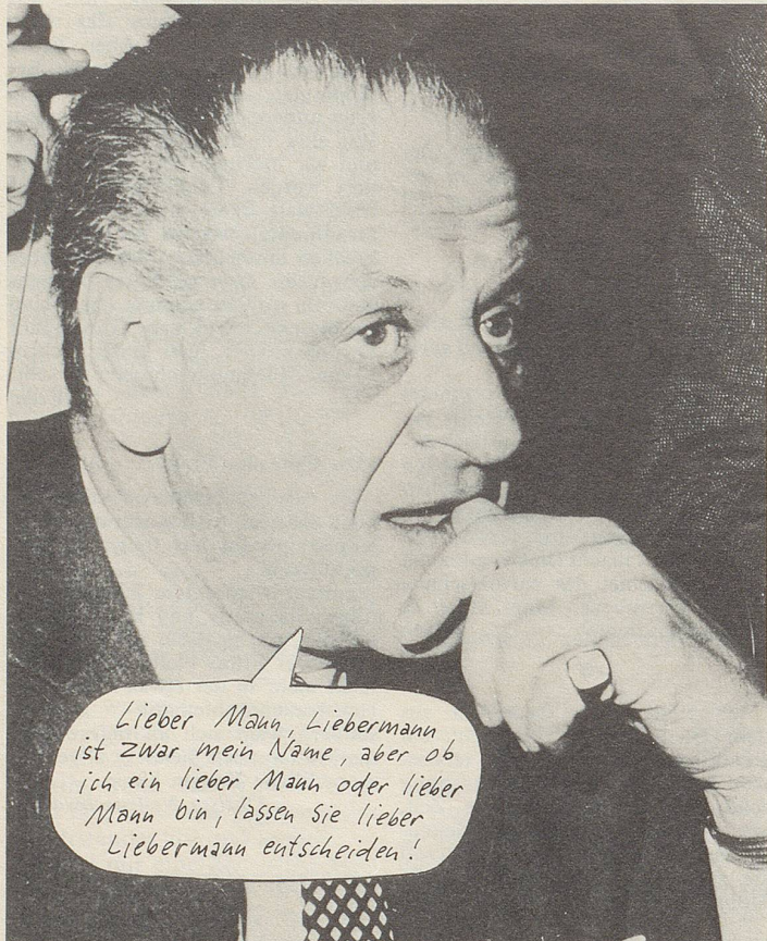
Opernhaus-Intendant Rolf Liebermann

Lieber Mann, Liebermann ist zwar mein Name, aber ob ich ein lieber Mann oder lieber Mann bin, lassen Sie lieber Liebermann entscheiden!