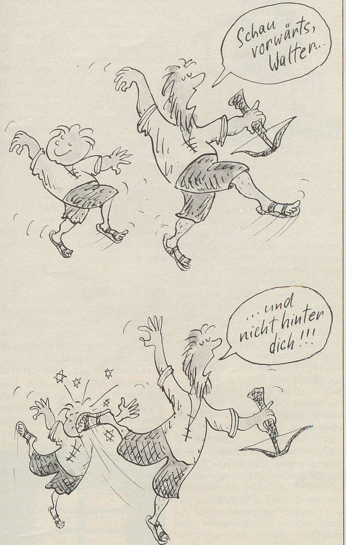
Zeichnung: Magi Wechsler

In Zürich wird zurzeit das Musical «Wilhelm Tell!» aufgeführt.