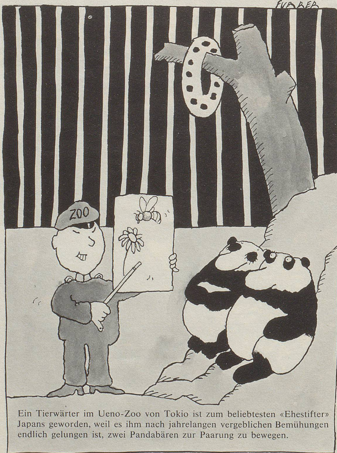
Ein Tierwärter im Ueno-Zoo von Tokio ist zum beliebtesten «Ehestifter» Japans geworden, weil es ihm nach jahrelangen vergeblichen Bemühungen endlich gelungen ist, zwei Pandabären zur Paarung zu bewegen.