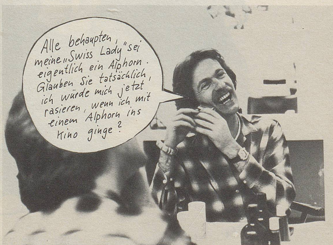
Bandleader Pepe Lienhard