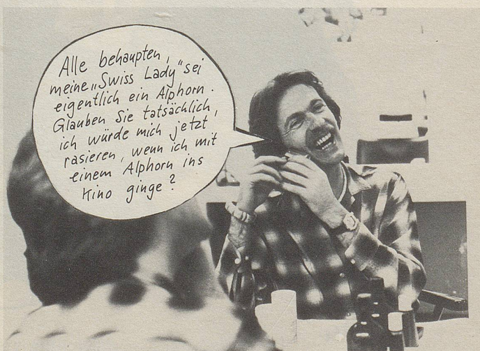
Bandleader Pepe Lienhard