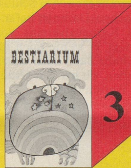
Jüsp Bestiarium 72 Seiten