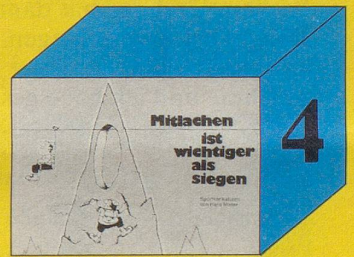
Hans Moser Mitlachen ist wichtiger als siegen 96 Seiten