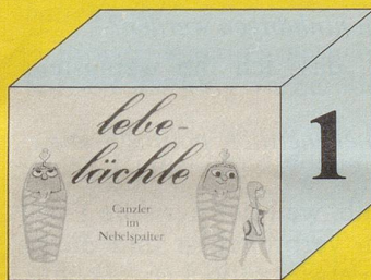
Canzler Lebe – lächle 88 Seiten

N.B. Schenken ist schön, Überzeugen ist besser!