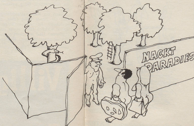
«Es ist noch ein Baum mit Schlange frei.»