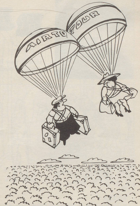
«Weisst du noch, wie die Indios heissen, bei denen wir eingebucht sind?»