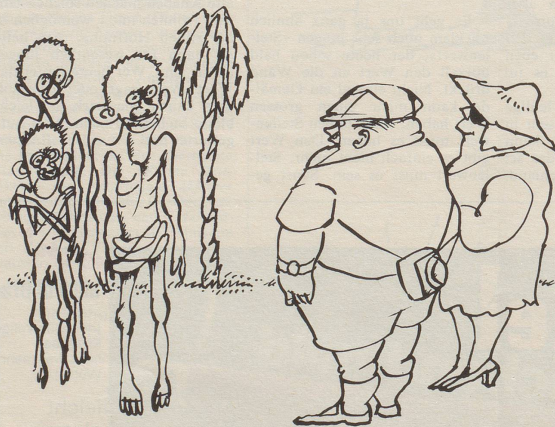
Dritte Welt macht Angebote für Diätferien. «Wenn Sie wüssten, wieviel Geld wir hinlegen, um nur einige Kilos zu verlieren.»