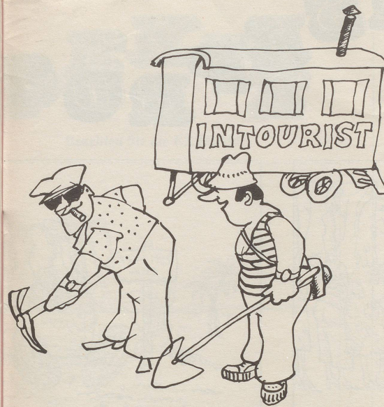
Ostländer organisieren Arbeitsferien für stellenlose Westler. «Ist es nicht ein herrliches Gefühl, wieder einmal gebraucht zu werden!?»