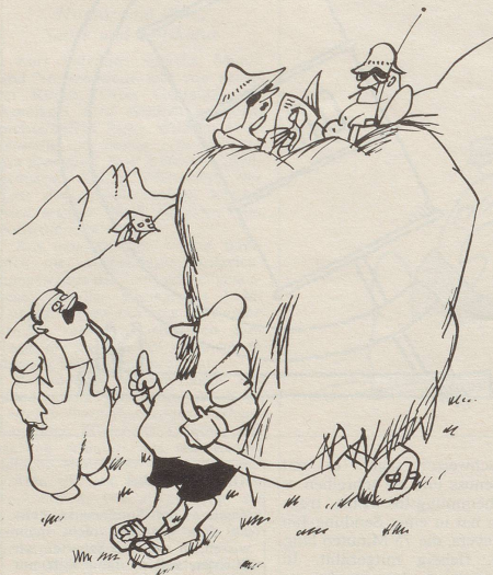
Das Reisebüro organisiert neuerdings Heuferien.