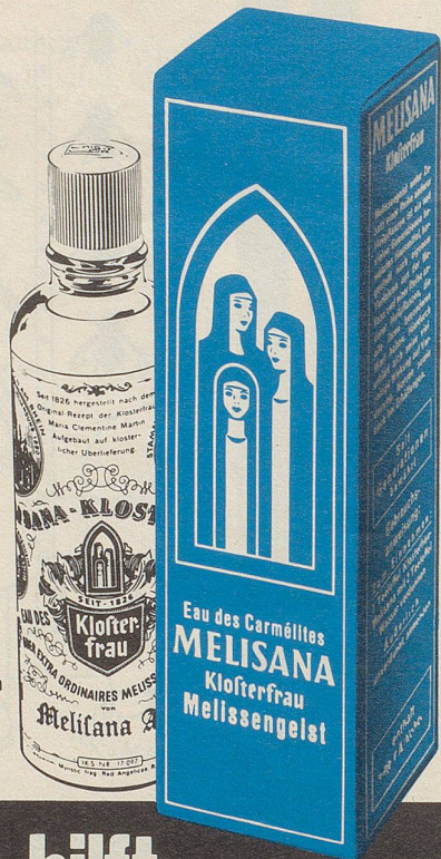
In Apotheken und Drogerien.

Besonders praktisch: Die flache Reiseflasche mit Trinkbecher.