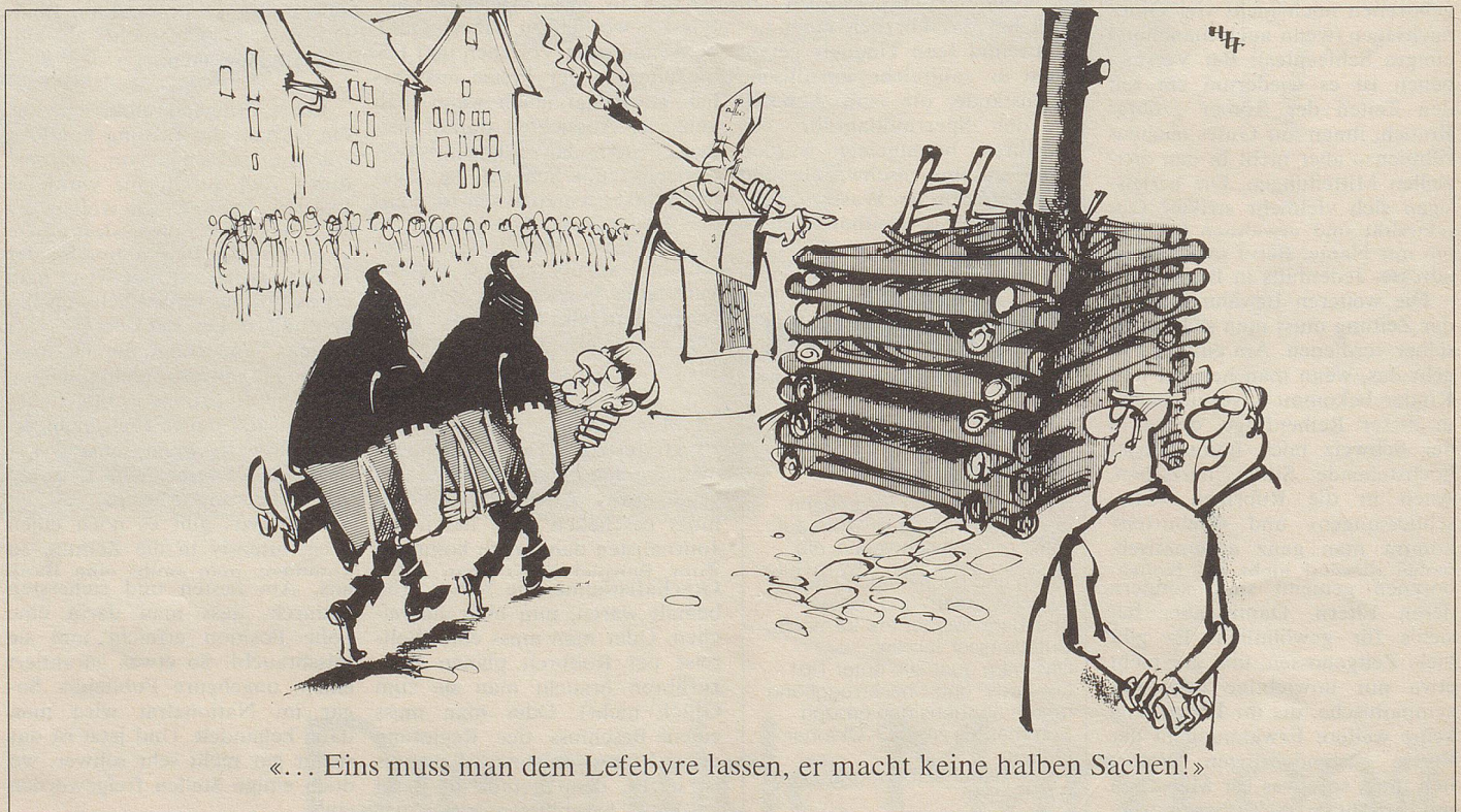
«... Eins muss man dem Lefebvre lassen, er macht keine halben Sachen!»