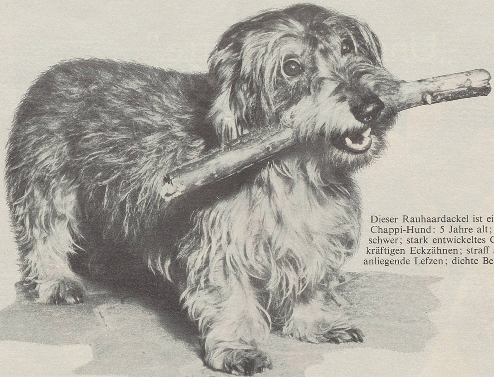
Dieser Rauhaardackel ist ein typischer Chappi-Hund: 5 Jahre alt; 5 1 / 2 kg schwer; stark entwickeltes Gebiss mit kräftigen Eckzähnen; straff am Kiefer anliegende Lippen; dichte Behaarung.