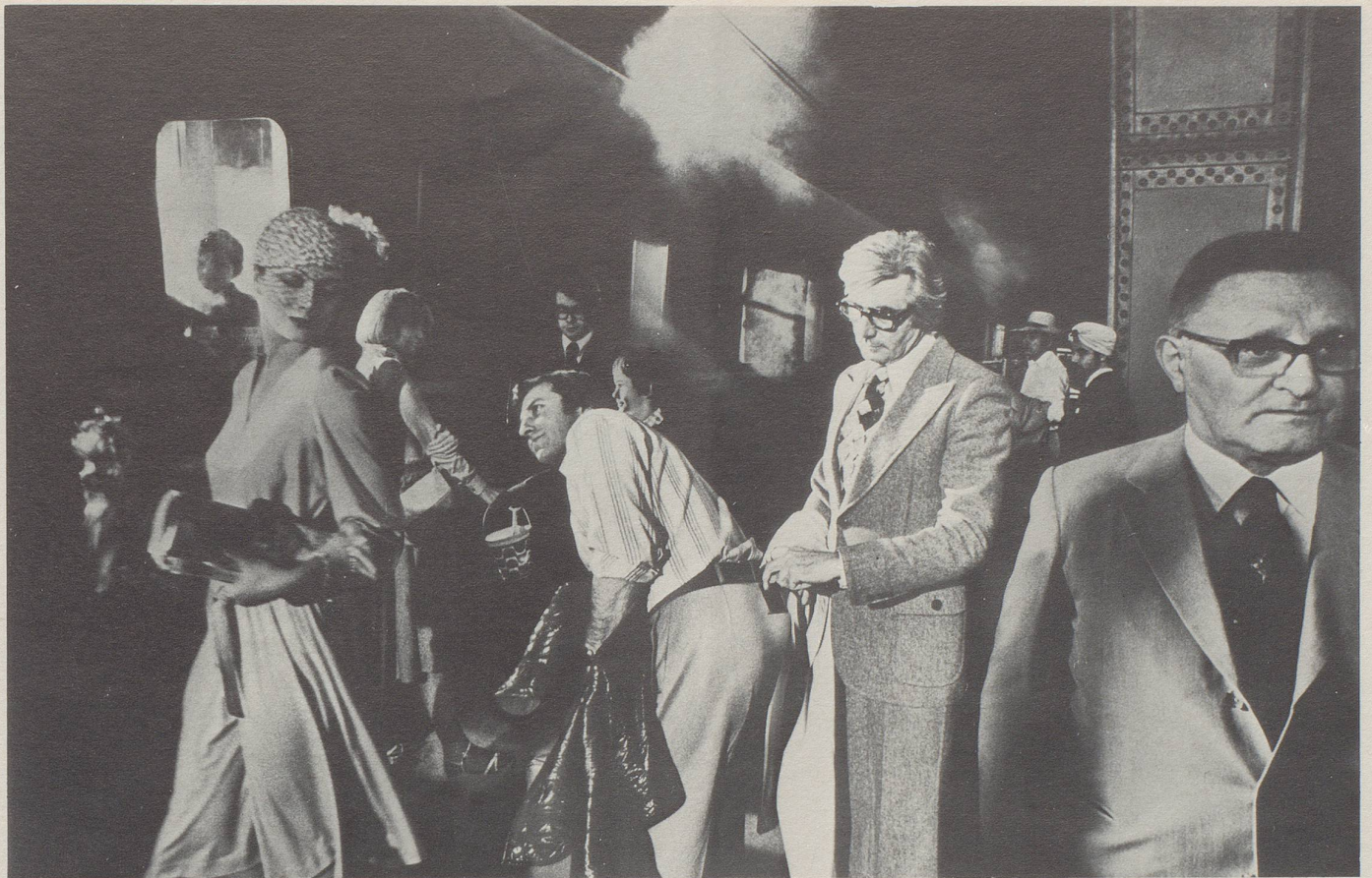
Die attraktive Frau lenkt den Mann ab, während ihr Komplize die Geldbörse stiehlt.