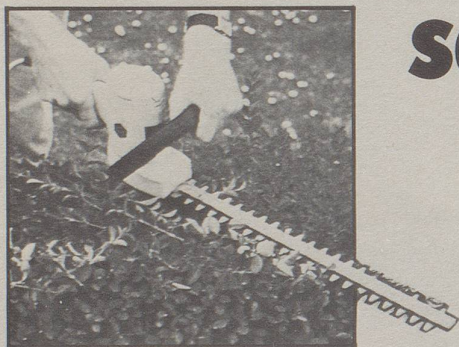
Elektro-Heckenscheren schon ab