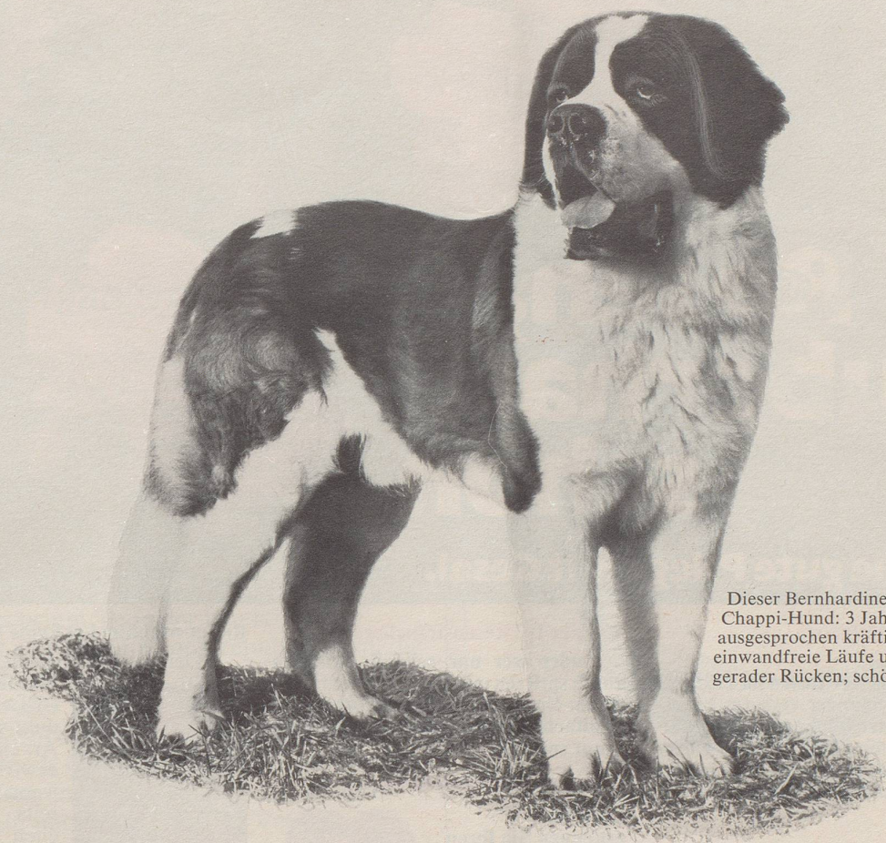
Dieser Bernhardiner ist ein typischer Chappi-Hund: 3 Jahre alt; 78 kg schwer; ausgesprochen kräftiger Knochenbau; einwandfreie Läufe und guter Stand; gerader Rücken; schöne Rutenhaltung.