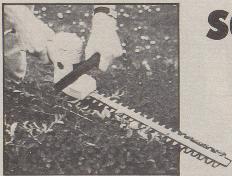
Elektro-Heckenscheren schon ab