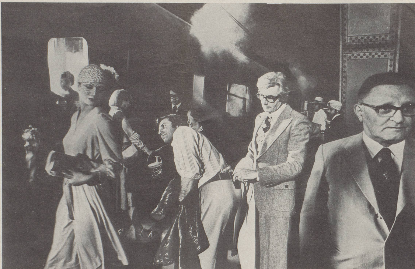
Die attraktive Frau lenkt den Mann ab, während ihr Komplize die Geldbörse stiehlt.