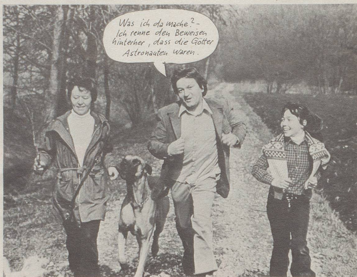
Erich von Däniken, der soeben sein neues Buch «Beweise» vorgelegt hat.