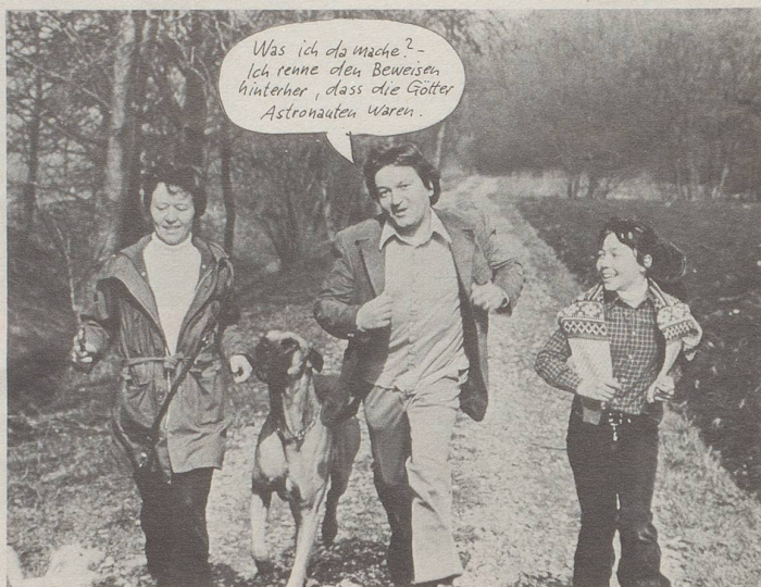
Erich von Däniken, der soeben sein neues Buch «Beweise» vorgelegt hat.