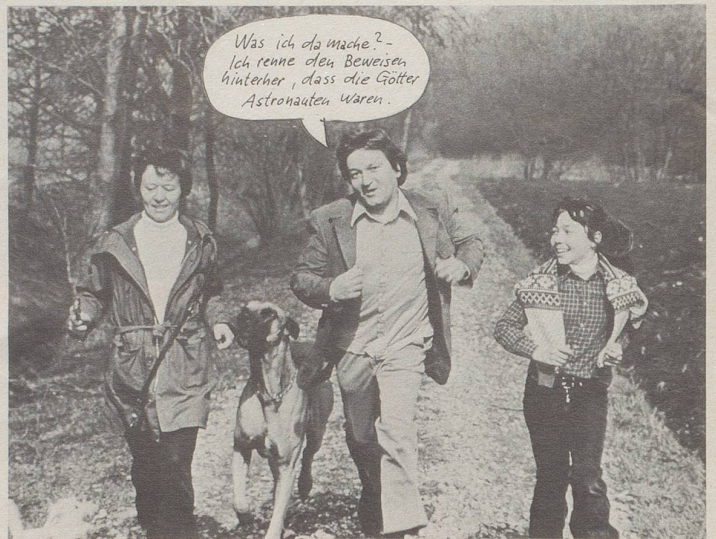
Erich von Däniken, der soeben sein neues Buch «Beweise» vorgelegt hat.