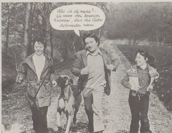
Erich von Däniken, der soeben sein neues Buch «Beweise» vorgelegt hat.