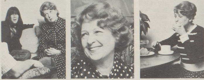
... beim Sprechen