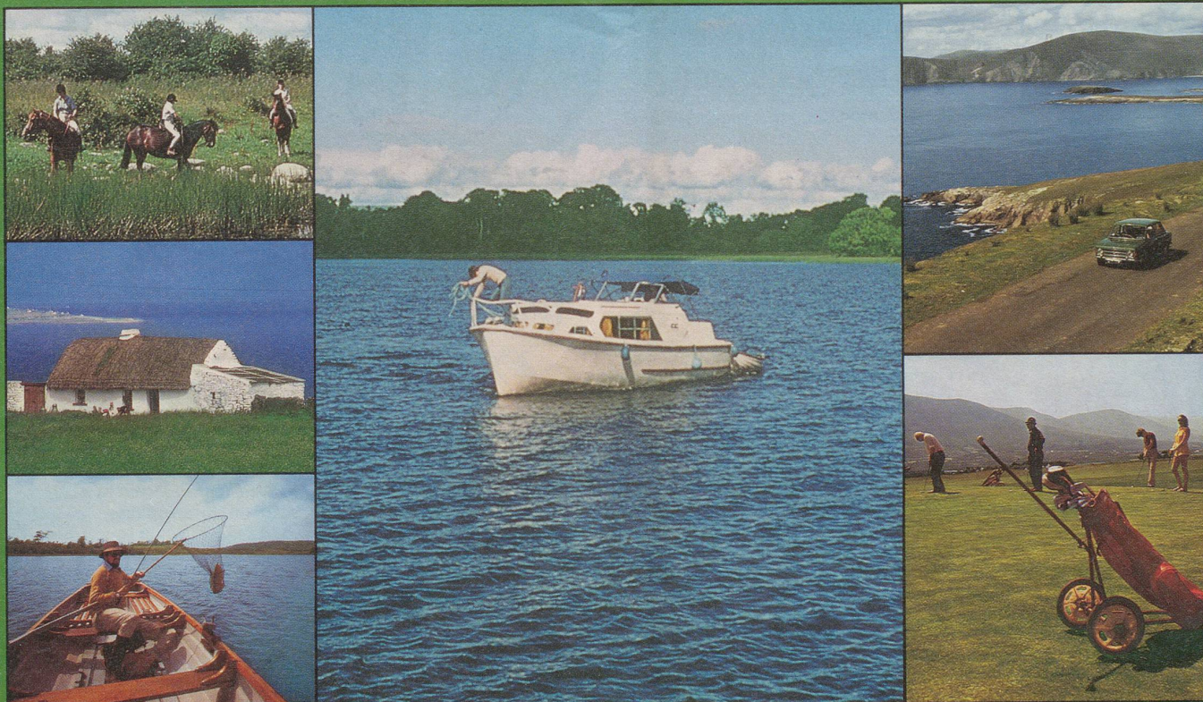
M.1 Walther - Leunberger BSR

Kennen Sie die romantische Insel im Atlantik, das Land der grünen Täler mit den vielen Strässchen, auf denen heute noch Entdeckungsfreudige im Zigeunrwagen dahinziehen? Kennen Sie das Land der blauen Flüsse, aus denen schon mancher den Fisch seines Lebens gezogen hat? Das Land der verträumten Städte und Flecken, der Sehenswürdigkeiten und der sommersprossigen Mädchen?