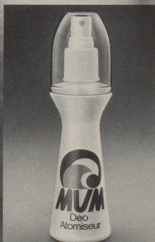
MUM Deo Atomiseur – aus dem gleichen Haus wie MUM Rollette: Bristol-Myers SA, 6330 Cham

Mum Deo Atomiseur schützt Sie mit einer Anwendung erfolgreich den ganzen Tag.