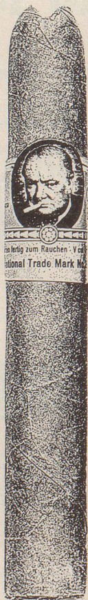
Churchill Morning (Sumatra), Churchill Brazil

Eine kleine Auslese aus der CHURCHILL Collection (in Etuis und Holzkistchen erhältlich)