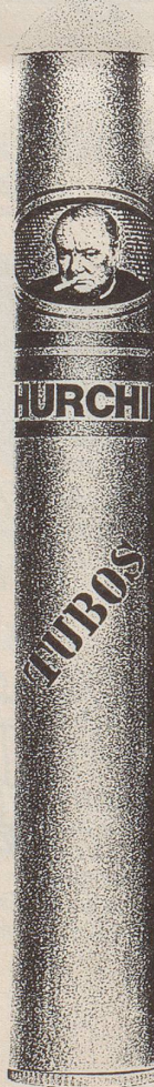
Tubos (Sumatra, Alu-tubes)