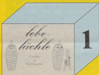
Canzler Lebe – lächle 88 Seiten

N.B. Schenken ist schön, Überzeugen ist besser!