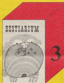
Jüsp Bestiarium 72 Seiten