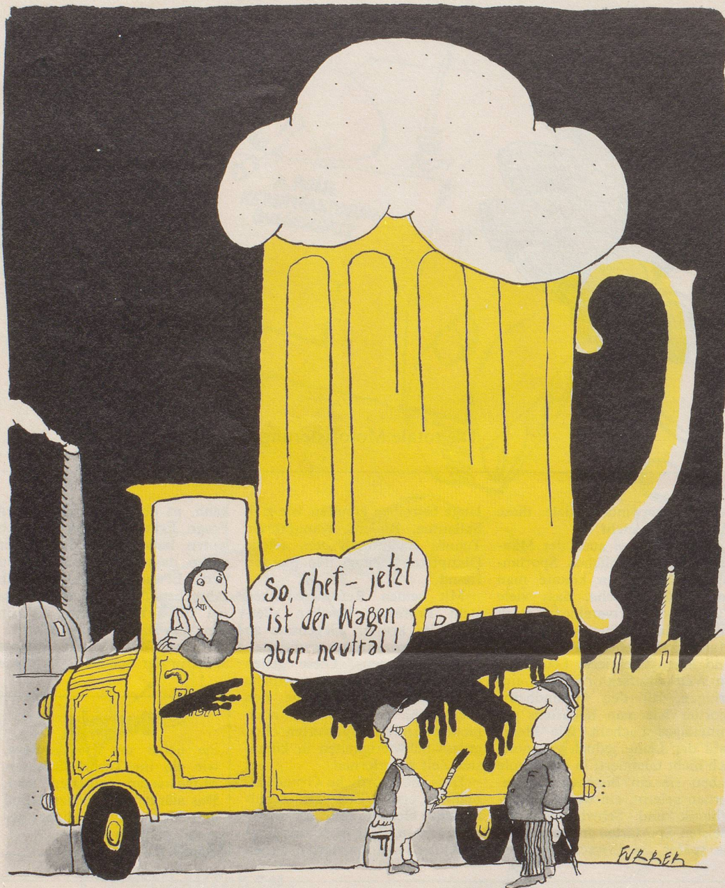
Ab 1. März ist in Finnland die Alkoholwerbung verboten. Das neue Gesetz schreibt sogar den Brauereien «neutrale» Lieferwagen vor, damit die Namen bekannter Getränke nicht zum Konsum anregen.