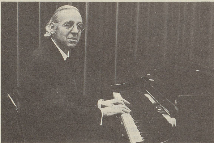
Unternehmer der Beruhigungs- und Tröstungsindustrie: Georg Kreisler