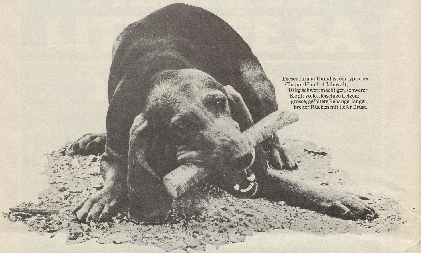
Dieser Juralaufhund ist ein typischer Chappi-Hund: 4 Jahre alt; 10 kg schwer; mächtiger, schwerer Kopf; volle, fleischige Lippen; grosse, gefaltete Behänge; langer, breiter Rücken mit tiefer Brust.