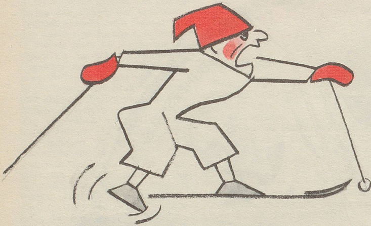
Der zweite russische Läufer hat unterwegs bei der 4×10-Kilometer-Staffel einen Ski verloren ...

Man sollte an die Olympischen Spiele gehen, um zweitens teilzunehmen (Mitmachen ist wichtiger als siegen!) und erstens, um zu gewinnen. Was nicht ausschliesst, dass man auch verlieren kann. Zum Beispiel: