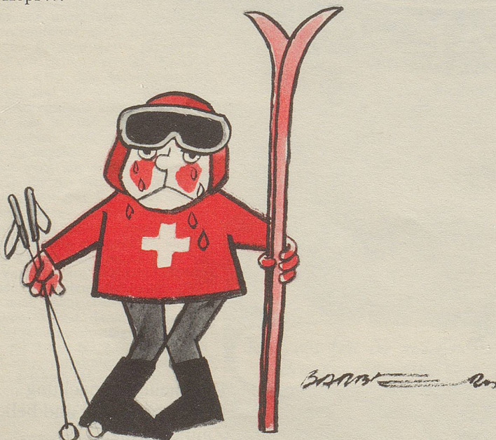
Unsere Skimädchen verloren alles, was zu verlieren war ...