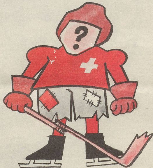
Die Eishockeyaner das Gesicht ...