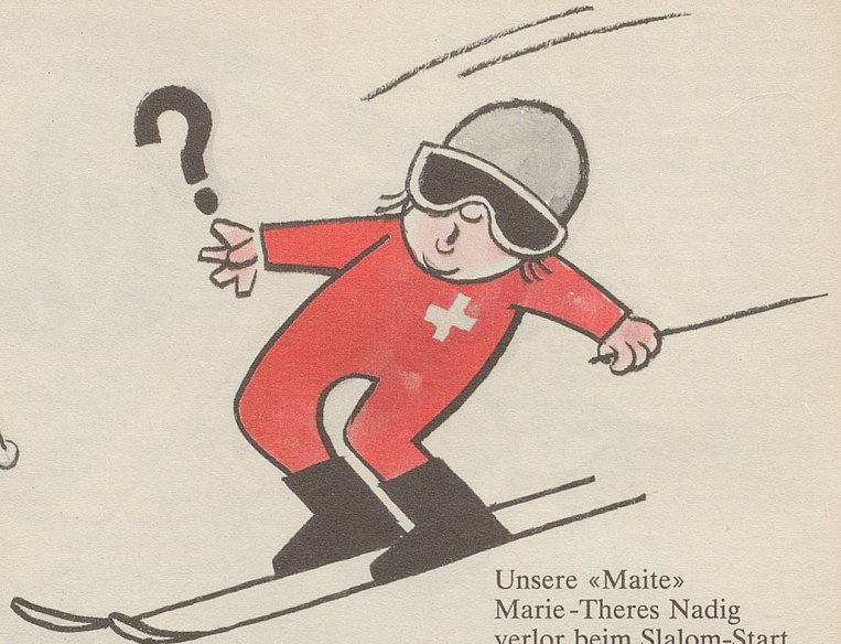
Unsere «Maite» Marie-Theres Nadig verlor beim Slalom-Start einen Stock ...