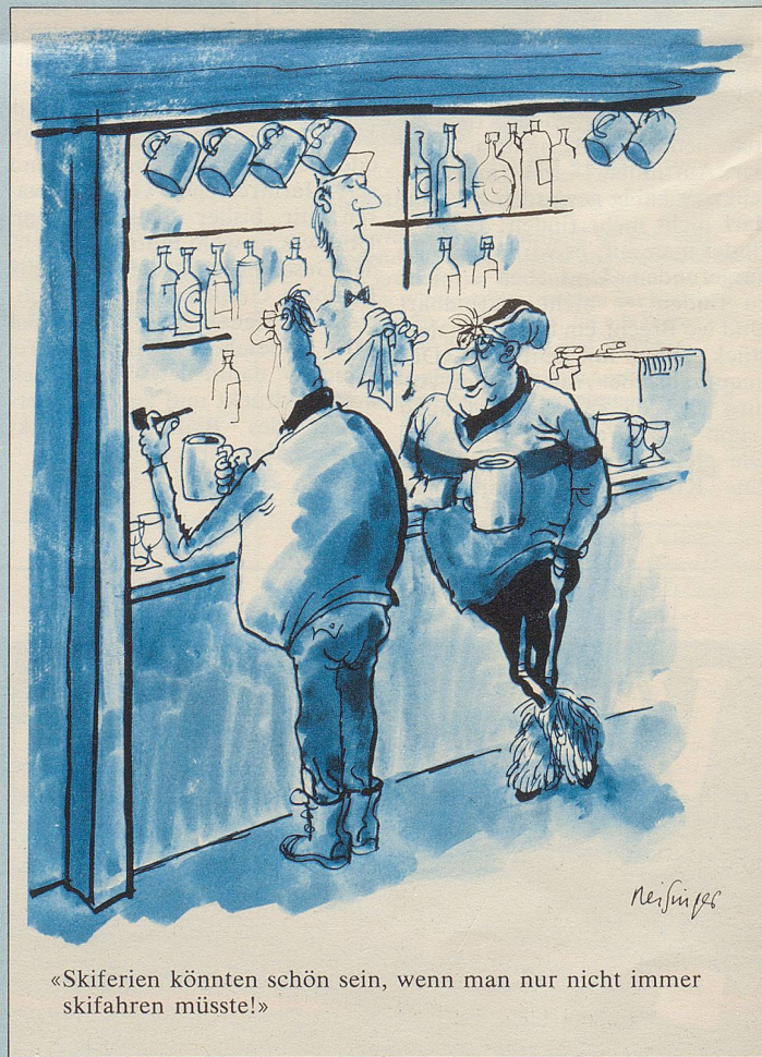
«Skiferien könnten schön sein, wenn man nur nicht immer skifahren müsste!»