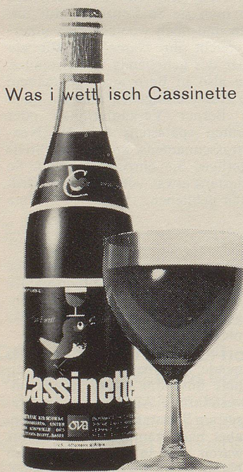
Was i wetti, isch Cassinette

Michi gehorcht nicht beim ersten Mal. Vati fragt ihn: «Wie mänglich muess mers dir eigentlich säge?» – «Zwöimoll!» LS