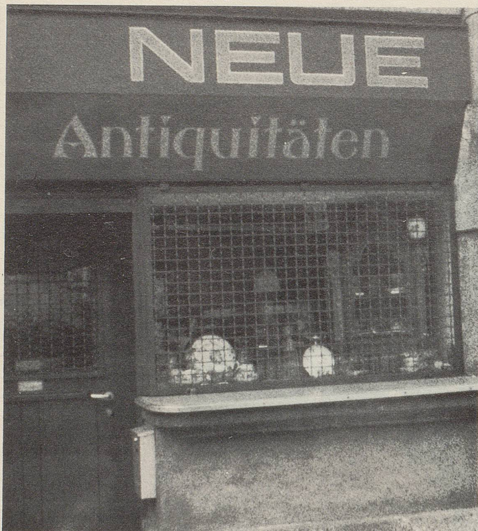
Am Hirschengraben in Zürich