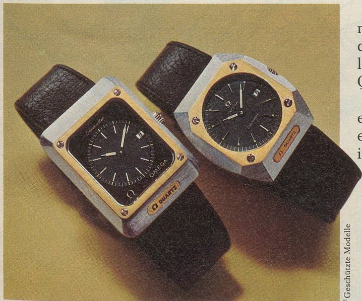
Die neuen Seamaster sind für Damen und für Herren erhältlich. Jedes Modell mit Stahl- oder mit Lederarmband. Von links nach rechts: Ref. 5850, Lederband, Fr. 925.-. Ref. 5875, Lederband, Fr. 895.-. Andere Quarzmodelle ab Fr. 475.-.

(Diese Seamaster Quarz Modelle sind lieferbar ab Dezember 1976)