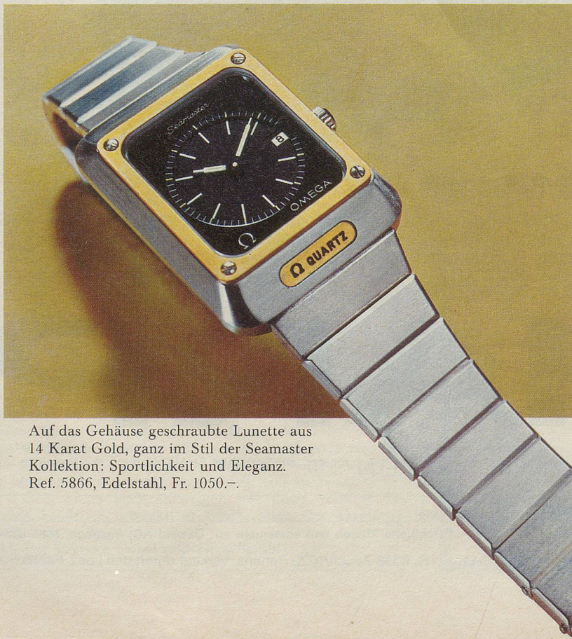
Auf das Gehäuse geschraubte Lunette aus 14 Karat Gold, ganz im Stil der Seamaster Kollektion: Sportlichkeit und Eleganz. Ref. 5866, Edelstahl, Fr. 1050.-.