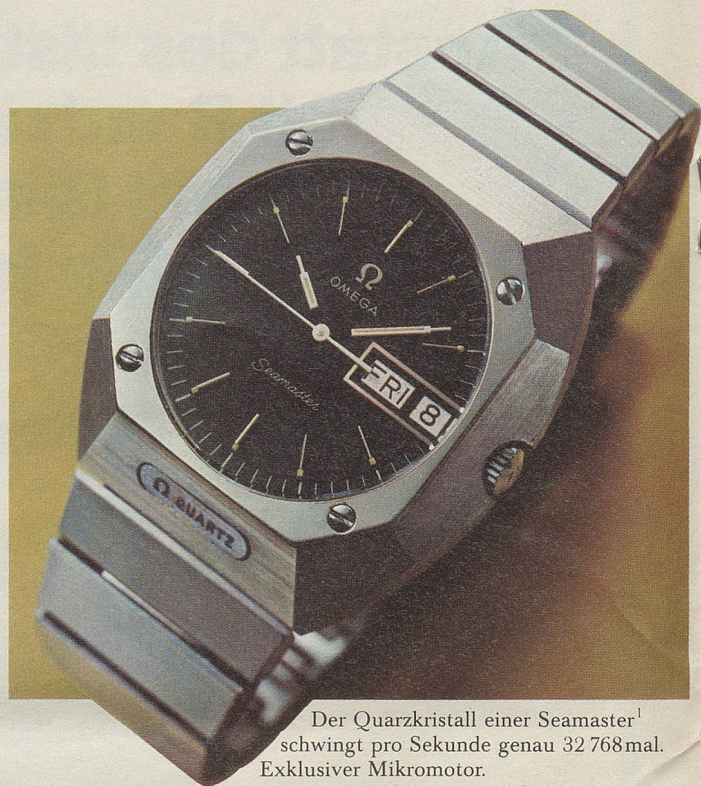
Der Quarzkristall einer Seamaster 1 schwingt pro Sekunde genau 32 768 mal. Exklusiver Mikromotor. Maximale Gangabweichung: 5 Sek./Monat. Ref. 5877, Edelstahl, Fr. 1000.-.

Und natürlich hat auch die neueste Generation jene Eigenschaften, die Omegas Seamaster berühmt gemacht haben: Zuverlässigkeit, Robustheit, Unverwüstlichkeit – erprobt unter dem Meeresspiegel, auf der Erde, im Weltraum. Aber nun verbunden mit quarzelektronischer Präzision.