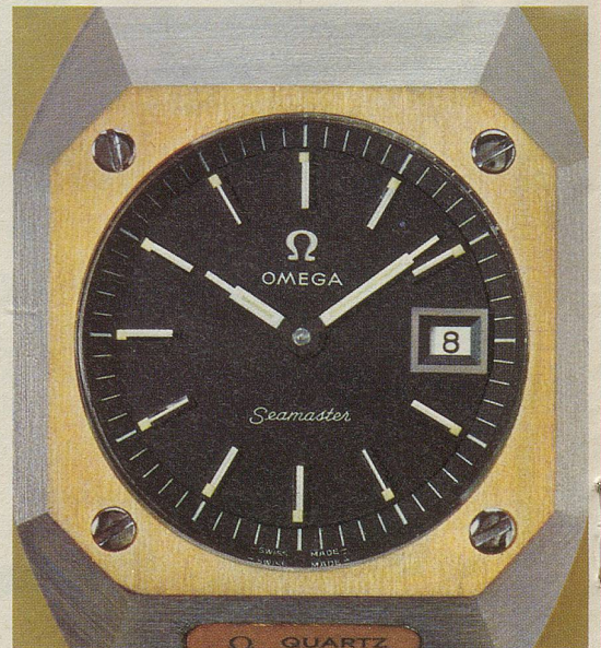
Bei der Herstellung des Gehäuses werden für die Astronautik entwickelte Techniken verwendet. Kratzfestes Saphirglas. Wasserdicht bis 3 atü.