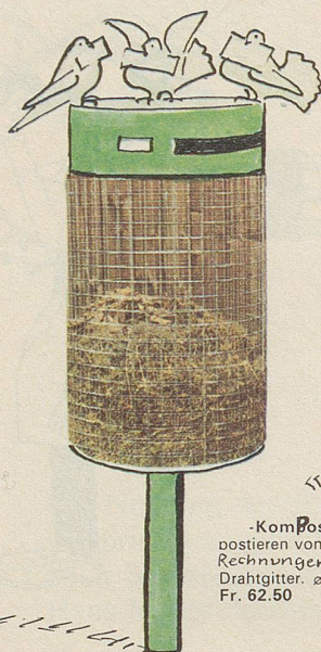
« Bio »

Das Bundesamt für Personaldezimierung und Ortsbildverpopung empfiehlt die folgenden EMPA-geprüften Modelle: