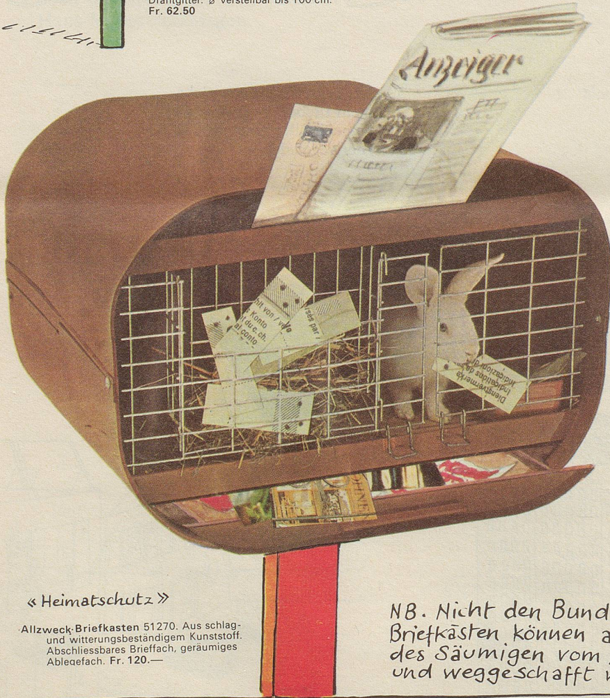
« Heimatschutz »

Dampfkasten mit Kernantrieb Weissblech, plutoniumisiert, umweltfreundlich Fr. Unbezahlbar.—