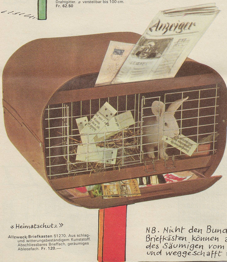
« Heimatschutz »

Dampfkasten mit Kernantrieb Weissblech, plutoniumisiert, umweltfreundlich Fr. Unbezahlbar.—