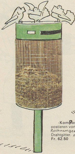
« Bio »

Das Bundesamt für Personaldezimierung und Ortsbildverpopung empfiehlt die folgenden EMPA-geprüften Modelle: