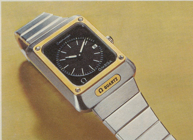
Auf das Gehäuse geschraubte Lunette aus 14 Karat Gold, ganz im Stil der Seamaster Kollektion: Sportlichkeit und Eleganz. Ref. 5866, Edelstahl, Fr. 1050.-.