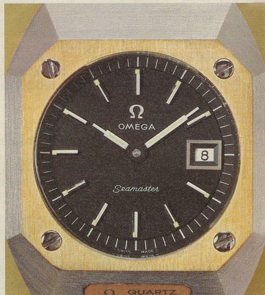
Bei der Herstellung des Gehäuses werden für die Astronautik entwickelte Techniken verwendet. Kratzfestes Saphirglas. Wasserdicht bis 3 atü.