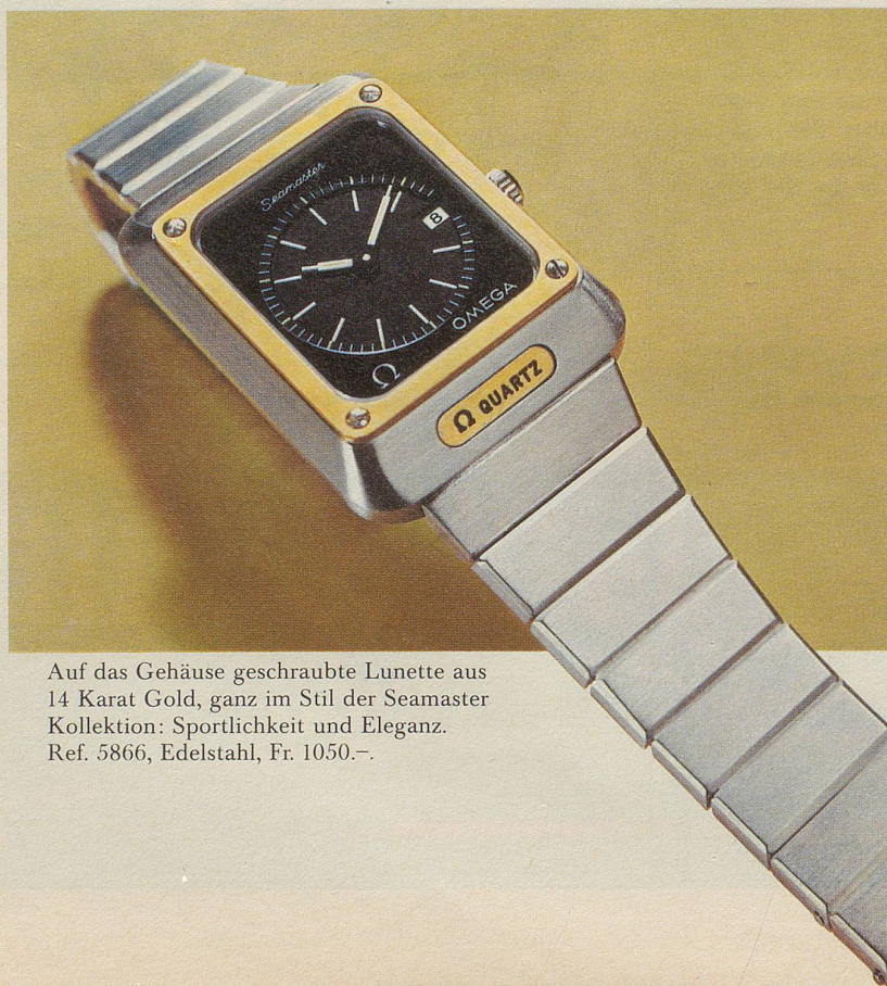
Auf das Gehäuse geschraubte Lunette aus 14 Karat Gold, ganz im Stil der Seamaster Kollektion: Sportlichkeit und Eleganz. Ref. 5866, Edelstahl, Fr. 1050.-.