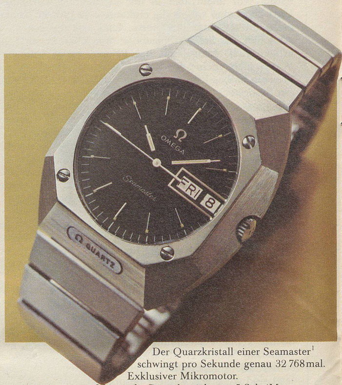
Der Quarzkristall einer Seamaster 1 schwingt pro Sekunde genau 32 768mal. Exklusiver Mikromotor. Maximale Gangabweichung: 5 Sek./Monat. Ref. 5877, Edelstahl, Fr. 1000.-.

Und natürlich hat auch die neueste Generation jene Eigenschaften, die Omegas Seamaster berühmt gemacht haben: Zuverlässigkeit, Robustheit, Unverwüstlichkeit – erprobt unter dem Meeresspiegel, auf der Erde, im Weltraum. Aber nun verbunden mit Quarzelektronischer Präzision.