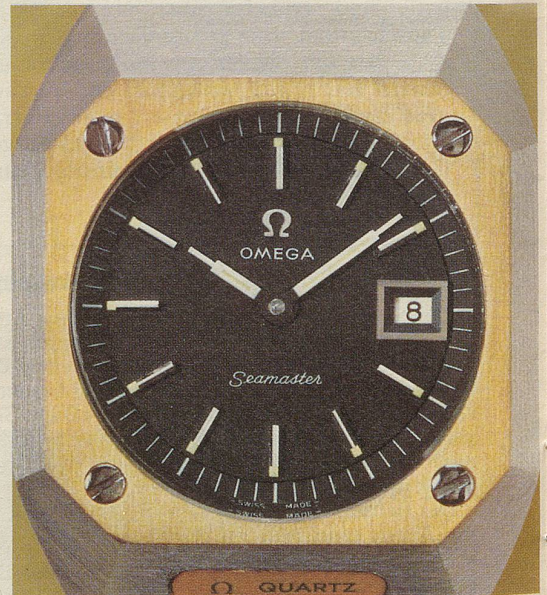
Bei der Herstellung des Gehäuses werden für die Astronautik entwickelte Techniken verwendet. Kratzfestes Saphirglas. Wasserdicht bis 3 atü.