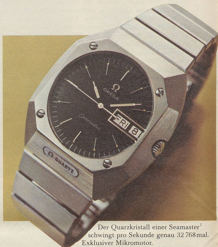
Der Quarzkristall einer Seamaster 1 schwingt pro Sekunde genau 32 768 mal. Exklusiver Mikromotor. Maximale Gangabweichung: 5 Sek./Monat. Ref. 5877, Edelstahl, Fr. 1000.-.

Und natürlich hat auch die neueste Generation jene Eigenschaften, die Omegas Seamaster berühmt gemacht haben: Zuverlässigkeit, Robustheit, Unverwüstlichkeit – erprobt unter dem Meeresspiegel, auf der Erde, im Weltraum. Aber nun verbunden mit quarzelektronischer Präzision.