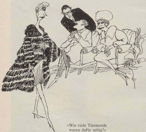
«Wie viele Tiermorde waren dafür nötig?»