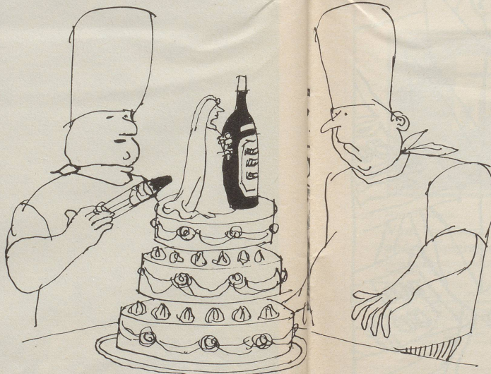
«Ich kenne den Bräutigam!»