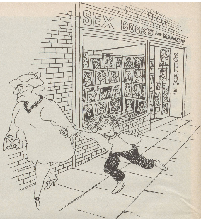
«Ich wollte ja gar nicht hingehen. Ich wartete nur, bis Vater herauskommen würde.»