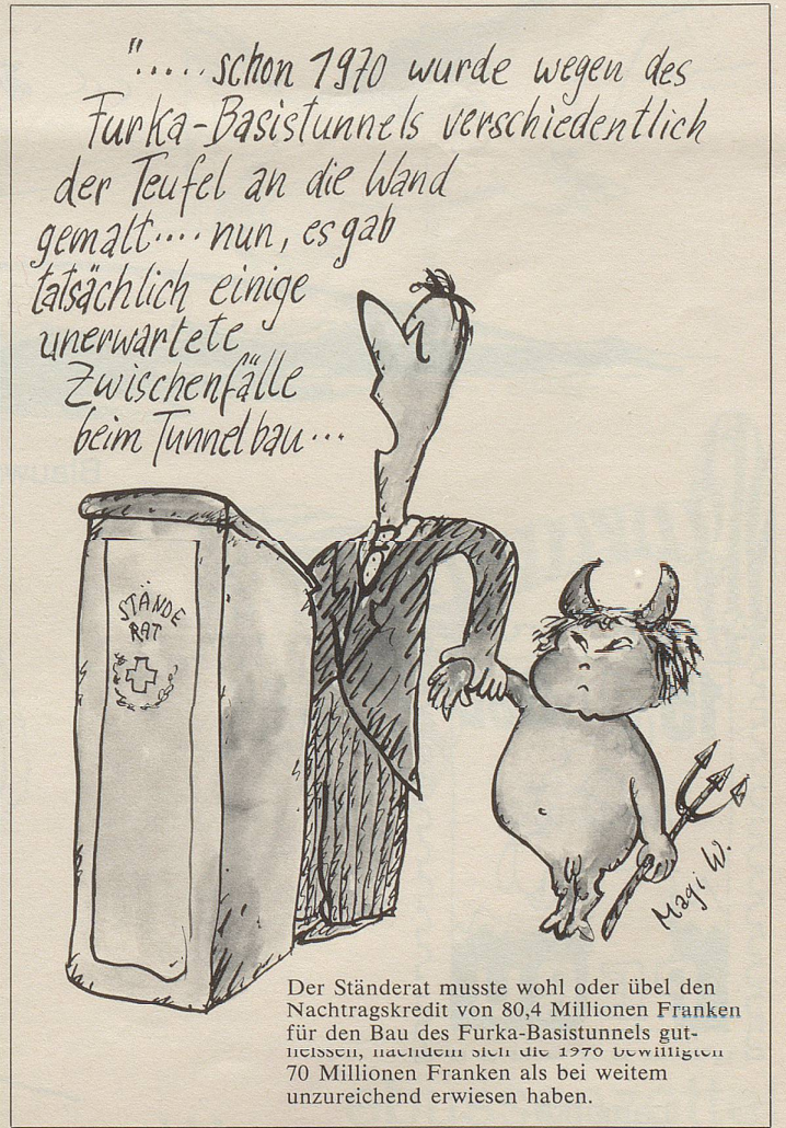
Der Ständerat musste wohl oder übel den Nachtragskredit von 80,4 Millionen Franken für den Bau des Furka-Basistunnels gutheissen, nachdem sich die 1970 bewilligten 70 Millionen Franken als bei weitem unzureichend erwiesen haben.