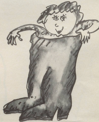
Die Stiefel: noch höher, noch wärmer, noch bequemer!