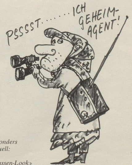
Besonders aktuell: der «Russen-Look»