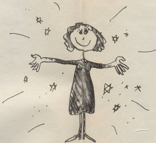
Bei jeder Bewegung knistert der Stoff elektrisch – ein ideales