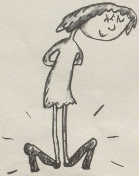
Schuhmode 76/77: die Absätze sind vorne!