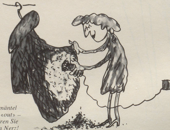
Pelzmäntel sind «out» – rasieren Sie Ihren Nerz!