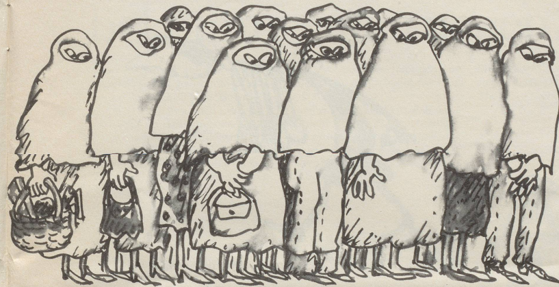
Aus dem Orient: der «Harem-Look»