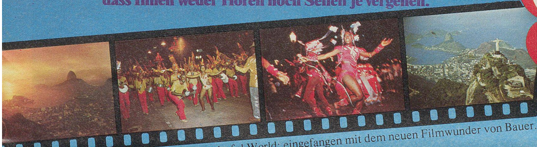
Martini's Wonderful World: eingefangen mit dem neuen Filmwunder von Bauer.

SUPER- WETTBEWERB! 750 Preise, Wert über 75000 Franken!