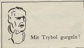
Mit Trybol gurgeln!

«Ganz gut. Sie beginnen meinem Bild ähnlich zu sehen.»