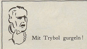
Mit Trybol gurgeln!

Jürgens: Haben Sie etwas gesagt? Was haben Sie gesagt? Können Sie nicht etwas lauter sprechen? Ich habe keine Silbe verstanden.