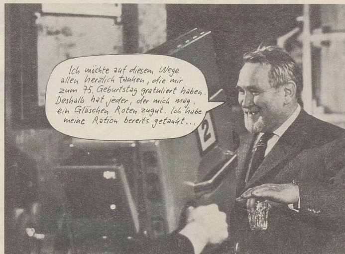
Jubilär Gustav Knuth vor der TV-Kamera