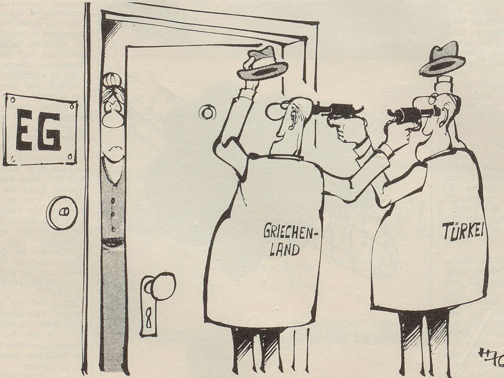
«Guten Tag, dürfen wir eintreten?»