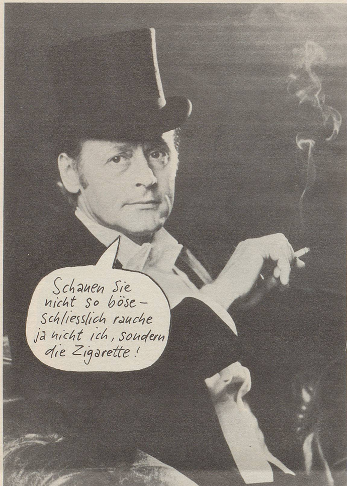
Schauspieler Helmut Lohner