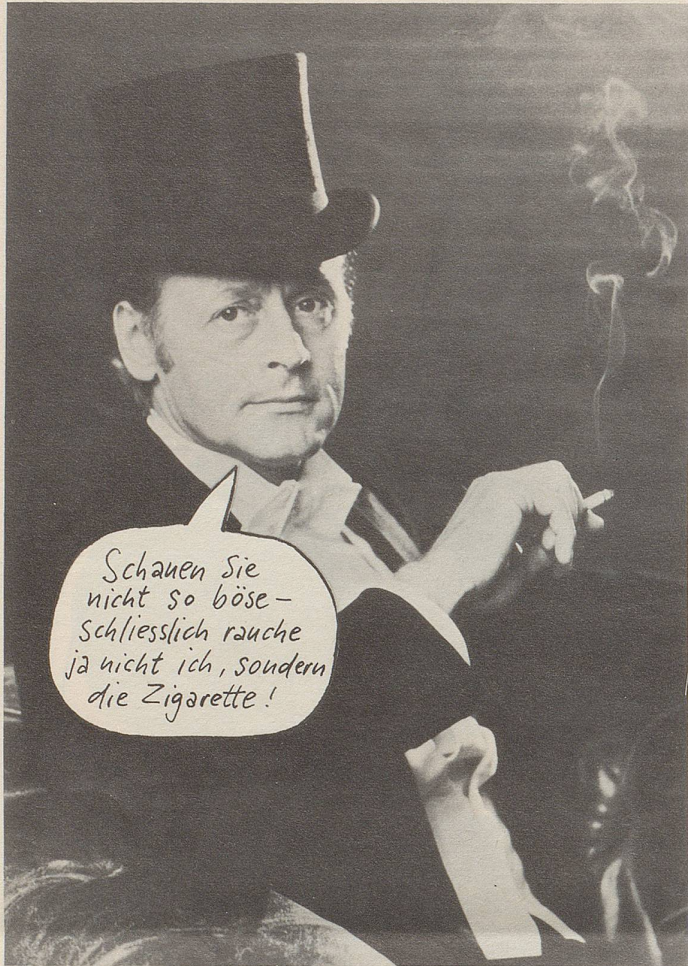
Schauspieler Helmut Lohner