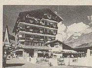
Hotel Christiania Karl Burgener