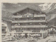
Hotel Derby David Supersaxo