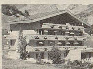
Hotel Elite Albert Anthamatten