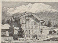
Hotel Allalin Gustav Zurbriggen

Diese Preise wurden gestiftet von folgenden 9 Hotels in Saas Fee: