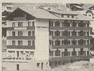
Hotel Astoria Silvan Oehen