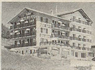
Garni-Hotel Des Alpes Augustin Zurbriggen