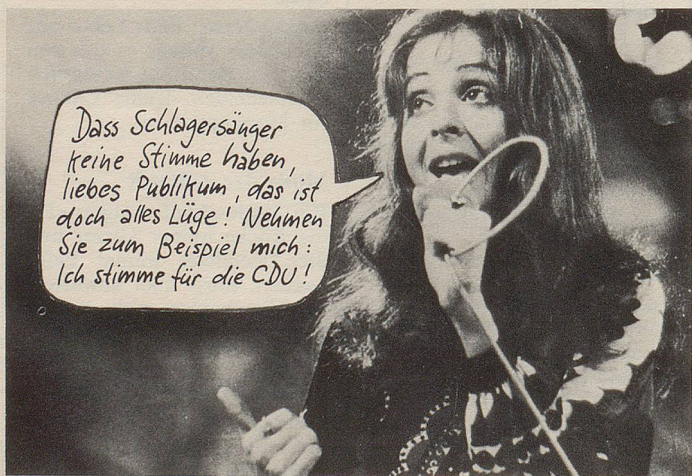
Schlagersängerin Vicky Leandros bei einem Auftritt.