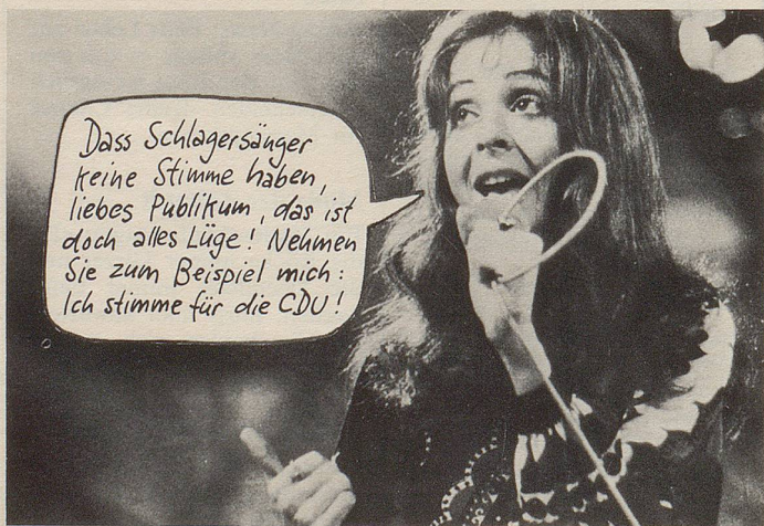
Schlagersängerin Vicky Leandros bei einem Auftritt.