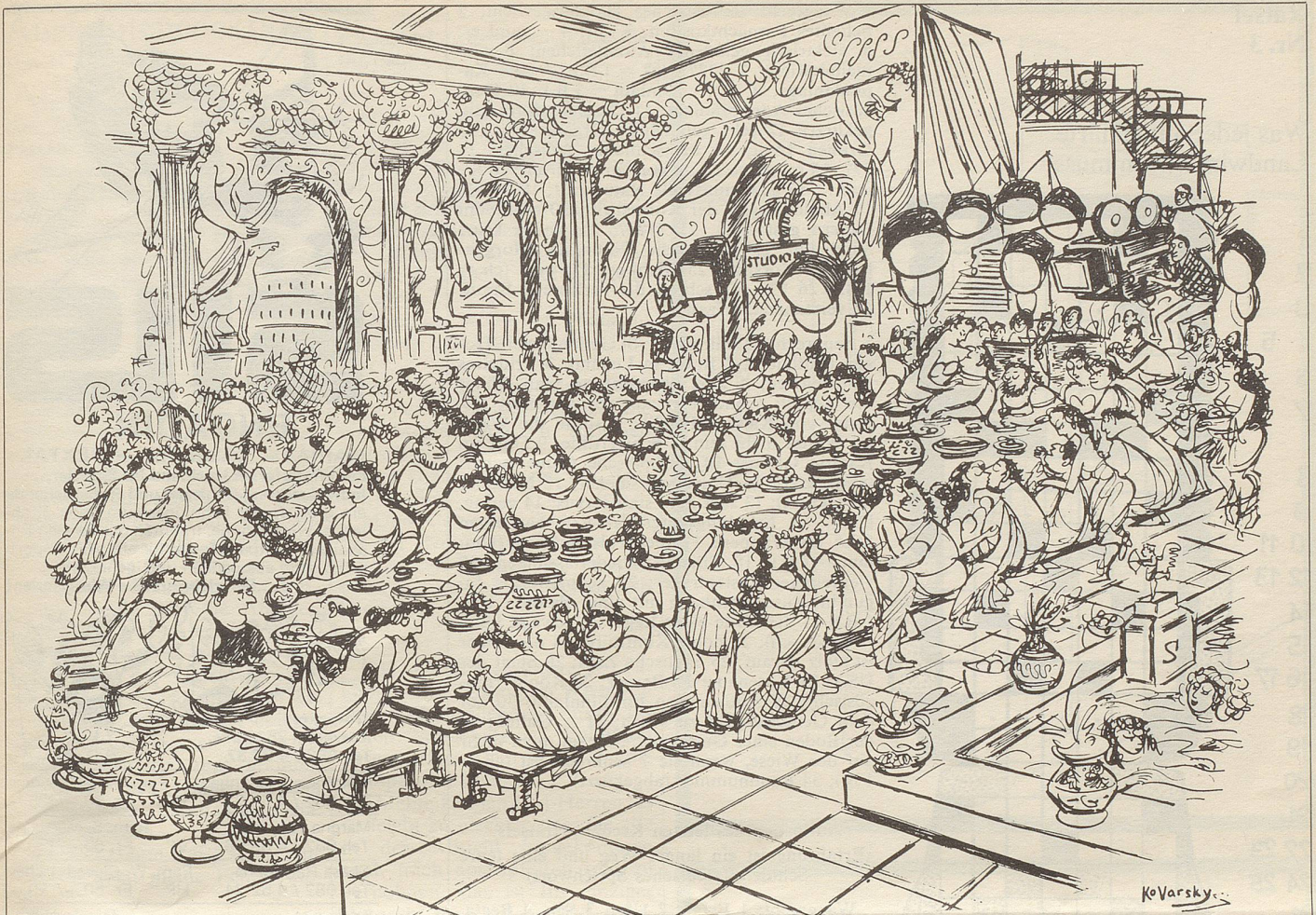
«Ich hoffe, dass die Aufnahme wiederholt werden muss. Diese Kirschtorte ist ausgezeichnet.»