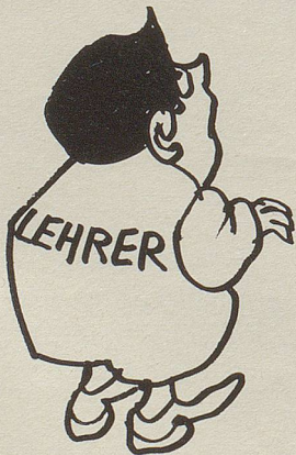
Die Verunsicherung unserer Lehrer nimmt ernste Formen an.