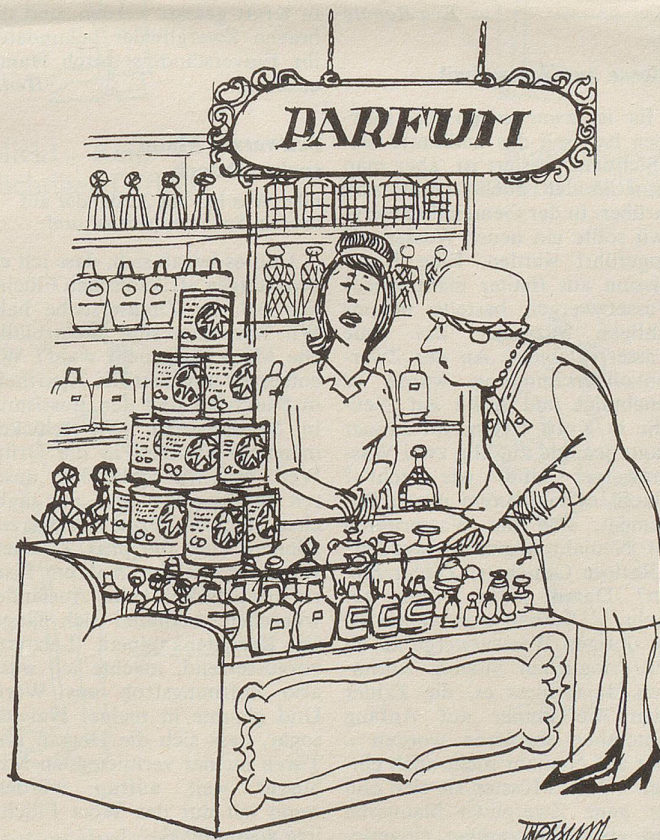
«Import aus der Sowjetunion!»

Muss denn dieses Soft-Ice, so frage ich mich, wirklich ausnahmslos überall, selbst im dichtesten Gedränge geschleckt werden? Aber eben, fasst eine derartige Sitte einmal Fuss, dann sorgt der Nachahmungstrieb sehr