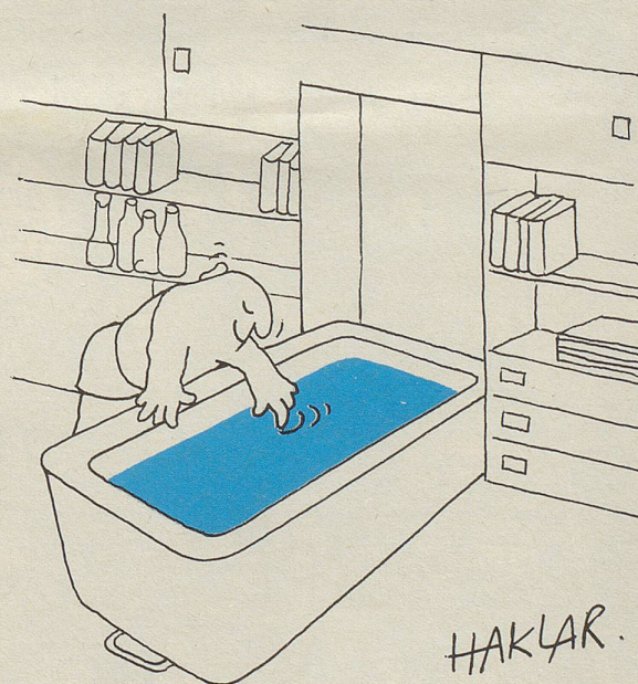
Sommerhit: Studio mit Einbaubad

Alles auf dieser Welt kann man rückgängig machen, bloss nicht das Wissen.