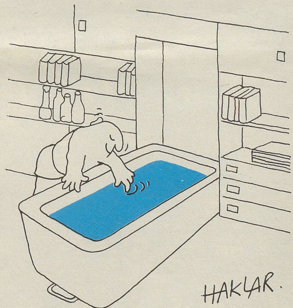
Sommerhit: Studio mit Einbaubad

Alles auf dieser Welt kann man rückgängig machen, bloss nicht das Wissen.